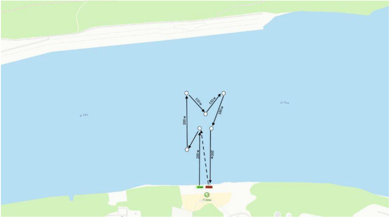
Схема «спринт», 200 м